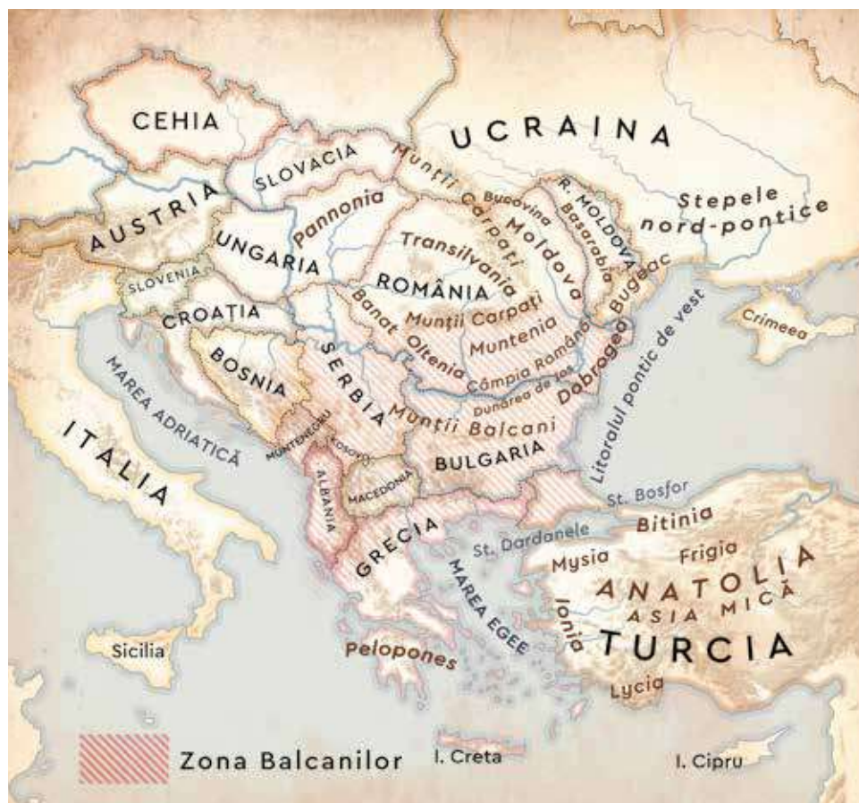
EUROPA DE SUD-EST cu granițele actuale și diversele denumiri geografice, noi sau antice, folosite în text.

GRECI, ROMANI, BARBARI Istoricii fac mereu distincția între civilizația grecească și, apoi, cea romană din jurul Mării Mediterane, pe de o parte, și popoarele din afara acestui spațiu, așa-numiții barbari, pe de altă parte. Azi, noi numim barbar pe cineva necioplit, grosolan sau brutal. În trecut, grecii i-au numit barbari pe cei ce vorbeau limbi străine, de neînțeles pentru ei. Barbarul era străinul ne-grec. Aici intrau și fenicienii, egiptenii sau latinii din Italia. Romanii au preluat termenul, dar i-au dat un sens mai restrâns. Pentru romani barbarii nu mai erau cei de altă limbă (și în niciun caz popoare precum egiptenii sau grecii), ci popoarele din afara lumii elenistice și romane – în special neamurile de dincolo de hotarele imperiului. Această lume, indiferent de neam, a primit și un nume: Barbaricum , „lumea barbară“.